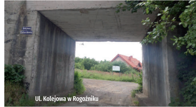
Ul. Kolejowa w Rogoźniku