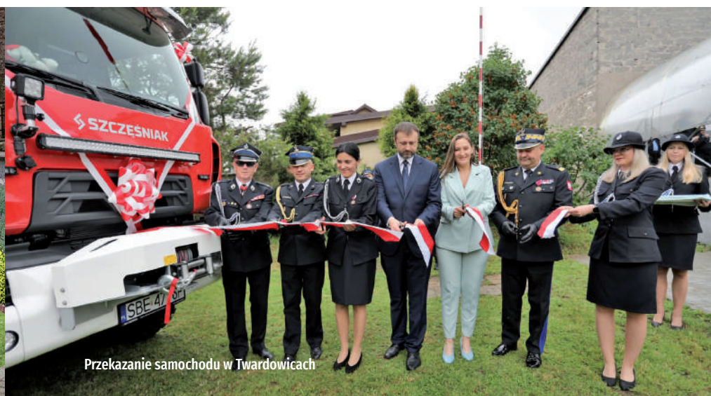
Przekazanie samochodu w Twardowicach

W tym roku kolejna straż otrzyma wymarzony nowy średni samochód ratowniczo-gaśniczy. Tym razem doinwestowana zostanie Ochotnicza Straż Pożarna z Wymysłowa.