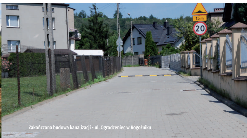
Zakończona budowa kanalizacji - ul. Ogrodzieniec w Rogoźniku

powinno być zakończone z początkiem grudnia.