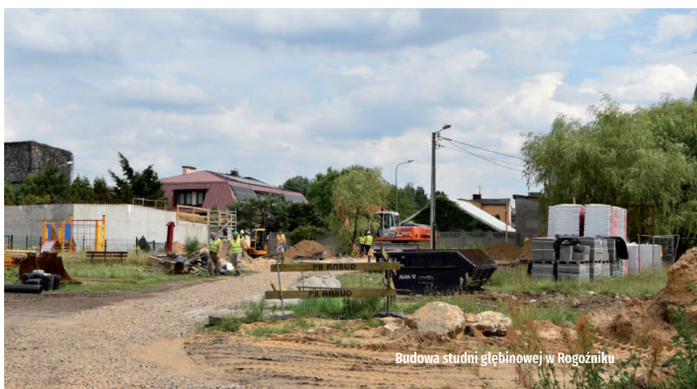
Budowa studni głębinowej w Rogoźniku