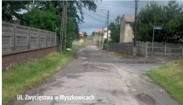
Ul. Zwycięstwa w Myszkowicach