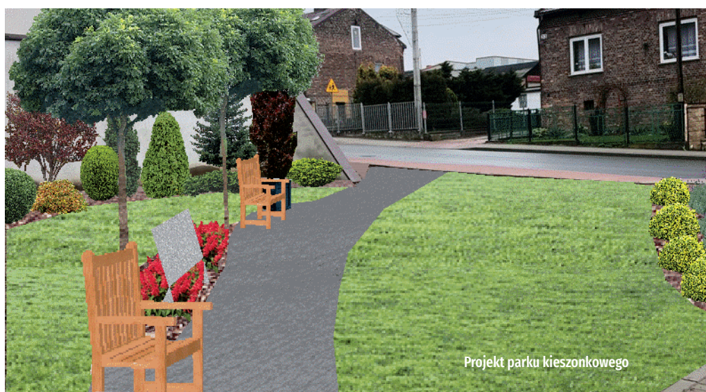
Projekt parku kieszonkowego