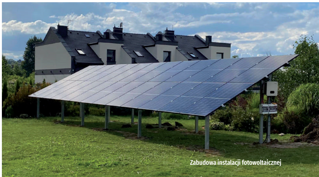
Zabudowa instalacji fotowoltaicznej

W Rogoźniku trwają prace przy budowie stacji uzdatniania wody, która powstaje przy istniejącej studni głębinowej w pobliżu hali widowiskowo-sportowej. Źródło zasilni mieszkańców Bobrownik, Dobieszowic oraz Rogoźnika. Wydobytą na powierzchnię wodę przejdzie proces uzdatniania, dzięki któremu zostanie pozbawiona szkodliwych dla zdrowia związków żelaza manganu, a następnie doprowadzona do ponad 5 tys. mieszkańców. Zadanie