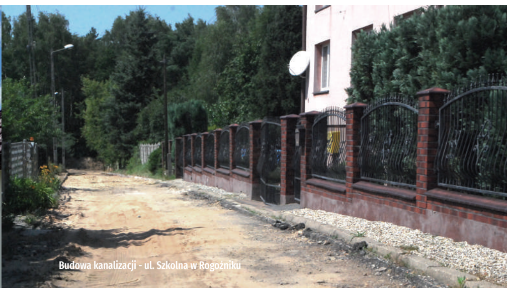
Budowa kanalizacji - ul. Szkolna w Rogoźniku