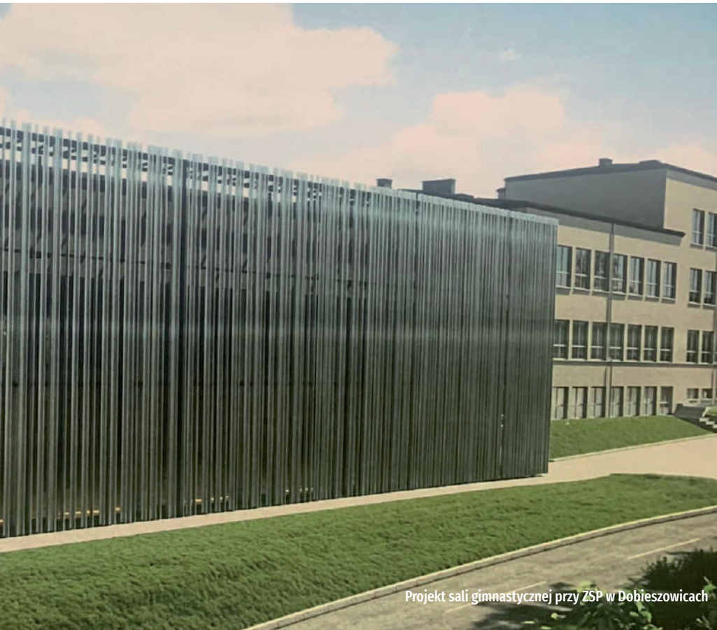
Projekt sali gimnastycznej przy ZSP w Dobieszowicach