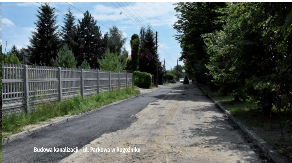
Budowa kanalizacji - ul. Parkowa w Rogoźniku