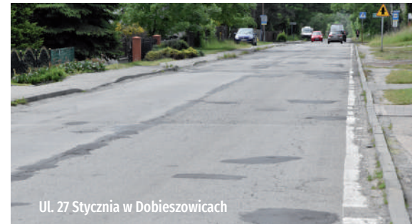
Ul. 27 Stycznia w Dobieszowicach