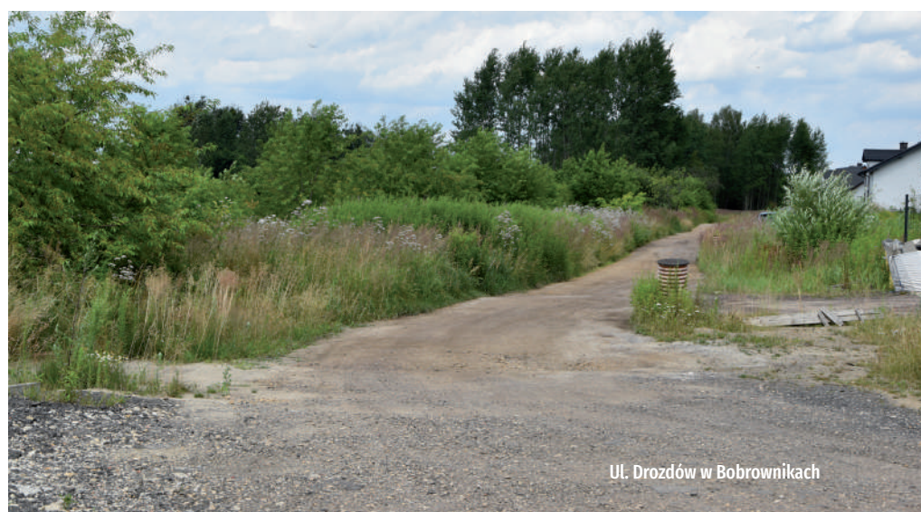
Ul. Drozdów w Bobrownikach