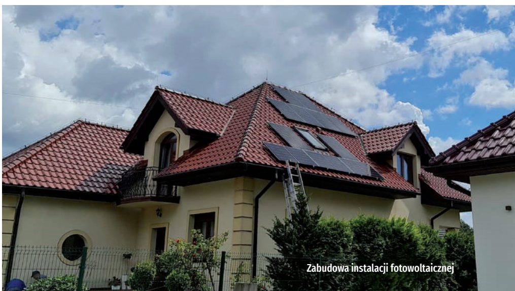
Zabudowa instalacji fotowoltaicznej