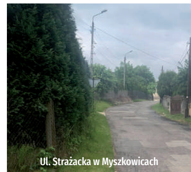
Ul. Strażacka w Myszkowicach

o nawierzchni asfaltowej z licznymi wybrakowaniami i dziurami. Ulica Strażacka również posiada liczne dziury, które odnawiają się po każdym sezonie zimowym. Na drogach brak kanalizacji deszczowej co powoduje liczne niedogodności podczas obfitych deszczów. Inwestycja przełoży się na rozwój spójnej sieci dróg publicznych, poprawi dostępność komunikacyjną, a tym samym wpłynie na jakość życia na tym obszarze.