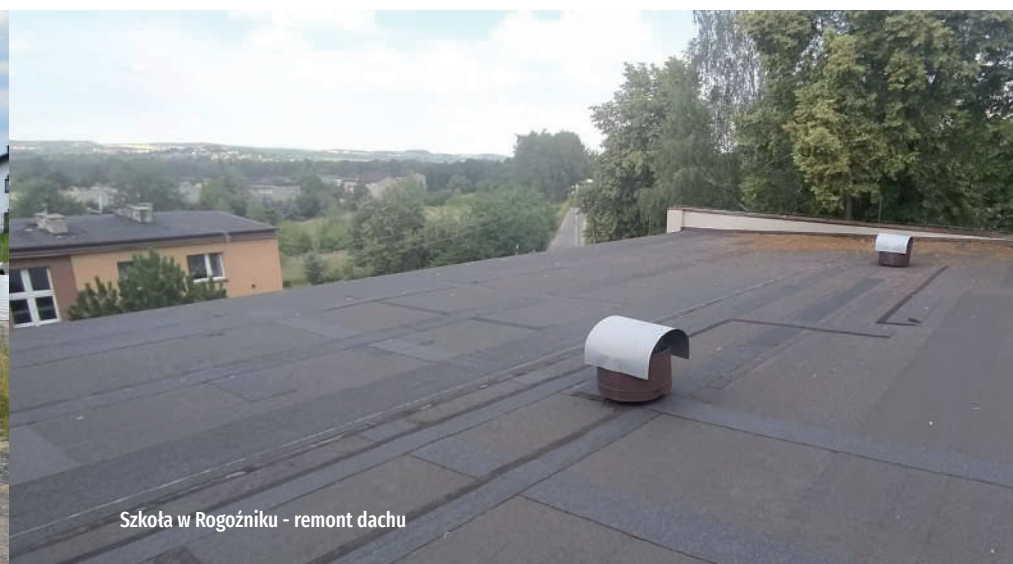
Szkoła w Rogoźniku - remont dachu

Około 150 tys. zł kosztować będą remonty dwóch szkolnych dachów - w Rogoźniku i Sączowie. W obu szkołach dotyczy to przestrzeni nad salami gimnastycznymi. Prace rozpoczęły się już i wykonane zostaną do 1. września. W Rogoźniku odświeżona będzie również sala gimnastyczna.