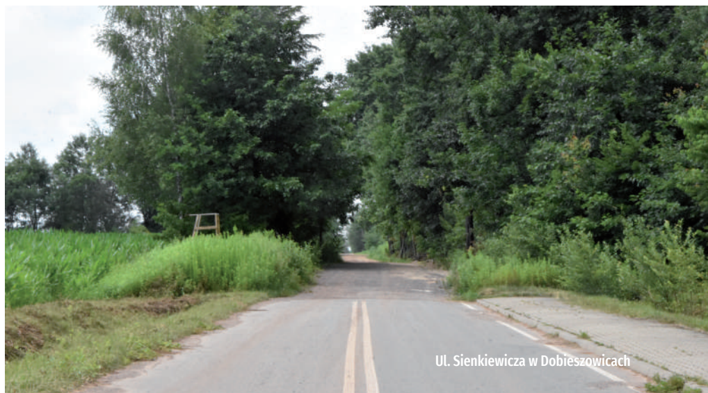
Ul. Sienkiewicza w Dobieszowicach

Ruszyła budowa Przedszkola Publicznego w Bobrownikach. Podpisano umowę z wykonawcą oraz przekazano plac